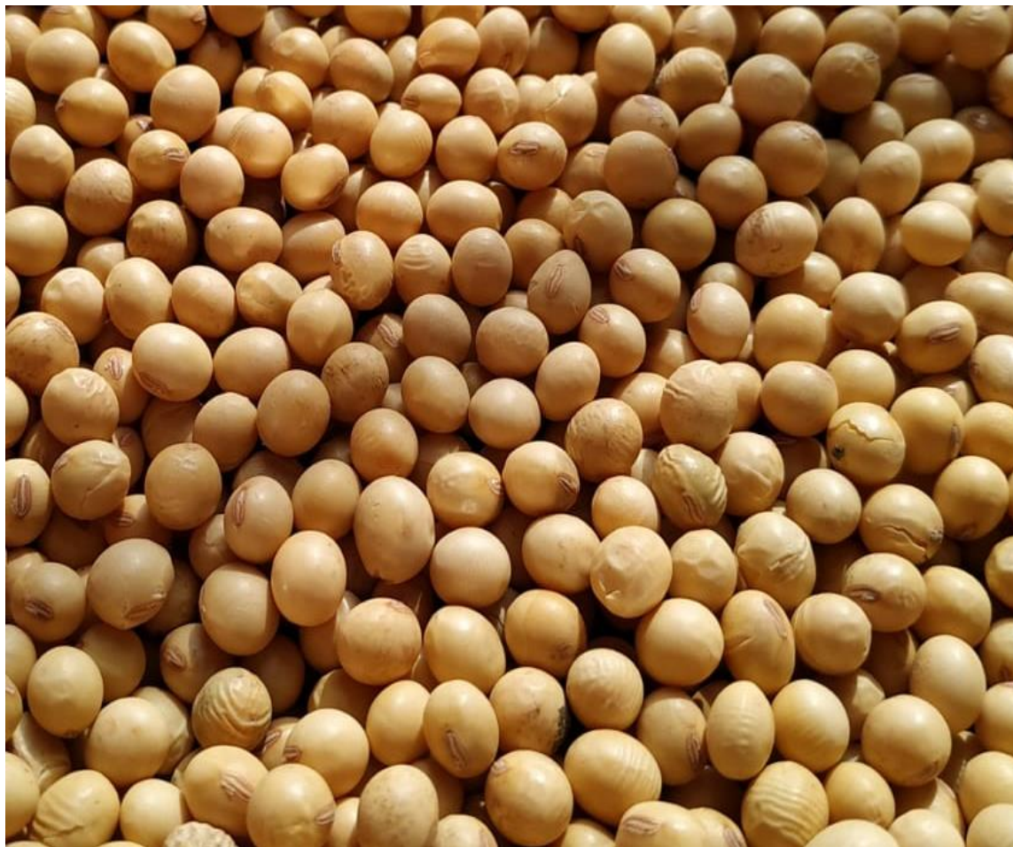
↑ 黒目 品種 La variedad de hilo negro