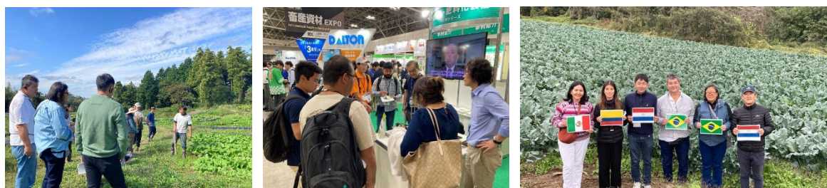
Fotos do Programa no Japão em 2024